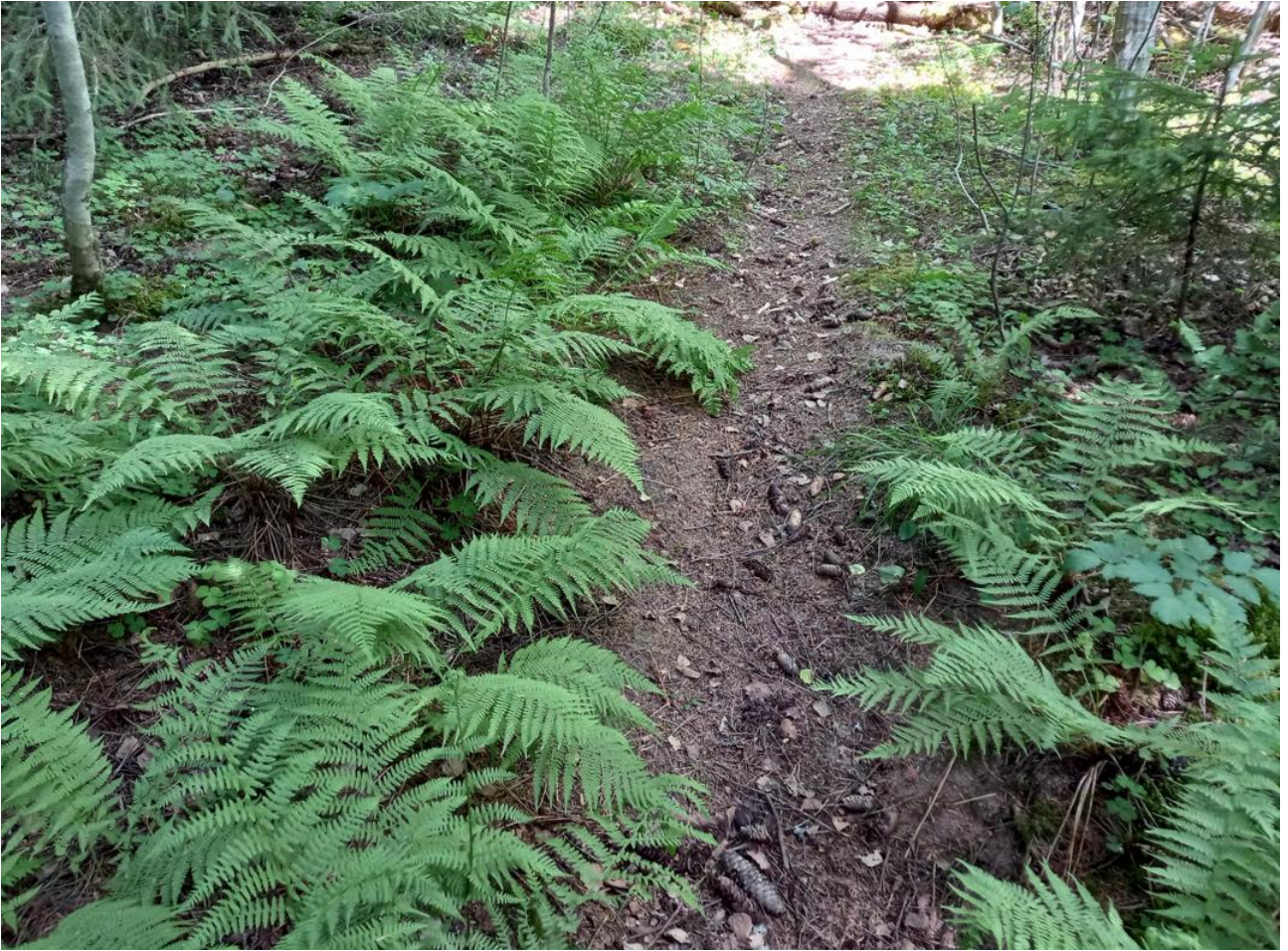
Kuva 5. Puistoalueella kulkeva polku ja sanikkaiskasvillisuutta.