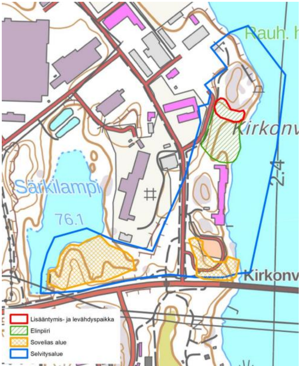
Kuva 2. Liito-oravan elinpiiri, lisääntymis- ja levähdyspaikka (punainen raja) ja lajille soveltuvat alueet (vihreä rasteri).