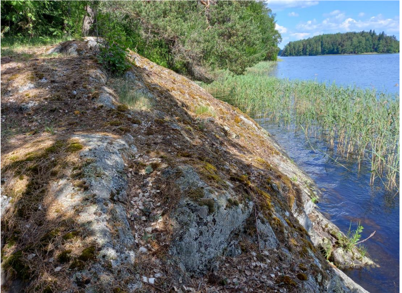
Kuva 4. Kaavamuutosalueen rantakalliota.