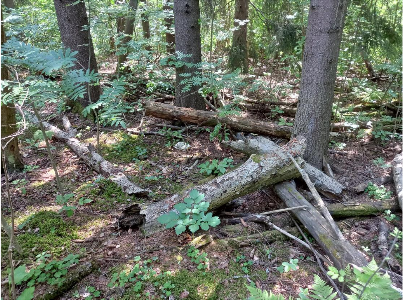
Kuva 3. Puistoalueella olevaa lahoppuustoa ja lehtokasvillisuutta (mustakonnamarja).